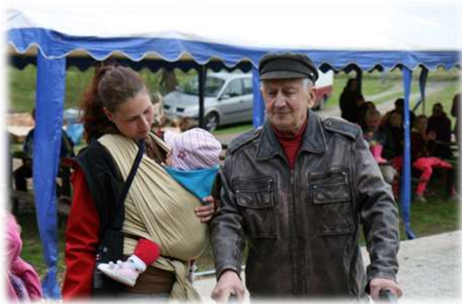
Nejmladší (uprostřed) a nejstarší účastník XVI. ročníku Rychnovského šlapáku